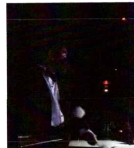
Ilustración 2 Primera presentación de la segunda temporada de la “Ópera El Pueblo K’iche’