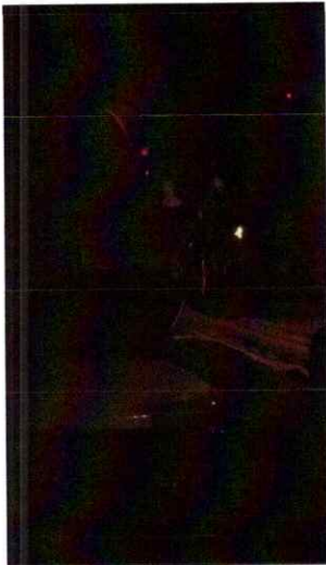
Ilustración 7 Cuarta presentación de la segunda temporada de la Ópera El Pueblo K'iche'

Realice la cuarta presentación de la ópera, interpretando los timbales en la sección de percusión, la cual fue la segunda presentación de la segunda temporada de la misma. Esta cuarta presentación fue dirigida al público en general. Link: https://drive.google.com/file/d/1NrzcW5pfbqrbktqCo4aVmlSzWjtja4Js/view?usp=sharing