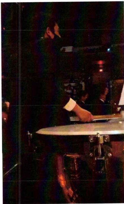
Ilustración 20 Décima presentación de la segunda temporada de la Ópera El Pueblo K'iche'

Realice la sexta presentación de la ópera, interpretando los timbales en la sección de percusión, la cual fue la décima y última presentación de la segunda temporada de la misma. Esta décima presentación fue dirigida al público en general y fue el cierre de la temporada. Link: https://drive.google.com/file/d/14xMnurAVPC_-Fs94p-r4vxu0m2A4r3p9/view?usp=sharing