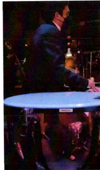
Ilustración 16 Octava presentación de la segunda temporada de la Ópera El Pueblo K'iche'