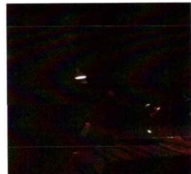
Ilustración 6 Tercera presentación de la segunda temporada de la Ópera Pueblo El K'iche'