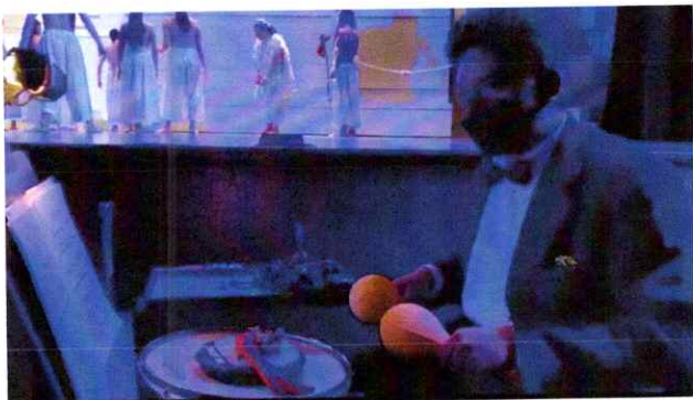
Ilustración 18 Novena presentación de la segunda temporada de la Ópera El Pueblo K'iche'

Realice la sexta presentación de la ópera, interpretando los chinchines y el redoblante en la sección de percusión, la cual fue la novena presentación de la segunda temporada de la misma. Esta novena presentación fue dirigida al público en general. Link: https://drive.google.com/file/d/1VatMaeP7-ReiopxjpFSy8bbJP8LREoJH/view?usp=sharing