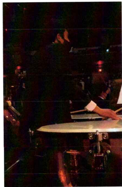
Ilustración 19 Décima presentación de la segunda temporada de la Ópera El Pueblo K'iche'