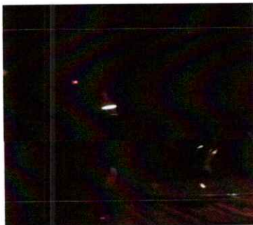
Ilustración 5 Tercera presentación de la segunda temporada de la Ópera Pueblo El K'iche'

Realice la tercera presentación de la ópera, interpretando los timbales en la sección de percusión, la cual fue la segunda presentación de la segunda temporada de la misma. Esta tercera presentación fue dirigida al público en general. Link: https://drive.google.com/file/d/15ImNa5Aw0N-Q6HsLrmGccuWLz_LW1ihQ/view?usp=sharing