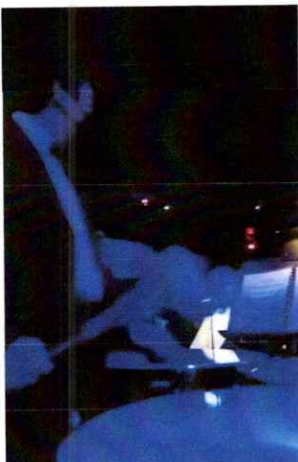
Ilustración 9 Quinta presentación de la segunda temporada de la Ópera El Pueblo K'iche'

Realice la quinta presentación de la ópera, interpretando los timbales en la sección de percusión, la cual fue la segunda presentación de la segunda temporada de la misma. Esta quinta presentación fue dirigida al público en general. Link: https://drive.google.com/file/d/145X6hIQ8KEFLG3vWoixVpa6ayySlo0R0/view?usp=sharing