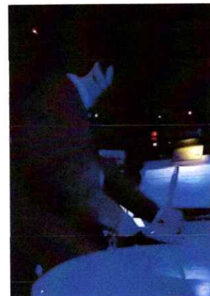
Ilustración 10 Quinta presentación de la segunda temporada de la Ópera El Pueblo K'iche'