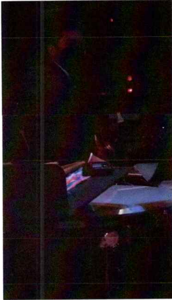
Ilustración 3 Segunda presentación de la segunda temporada de la Ópera El Pueblo K'iche'

Realice la segunda presentación de la ópera, interpretando los timbales en la sección de percusión, la cual fue la segunda presentación de la segunda temporada de la misma. Esta segunda presentación fue dirigida al público en general. Link: https://drive.google.com/file/d/1FPh3LJuujhceOLkF_HJxQp6roM3BISEc/view?usp=sharing