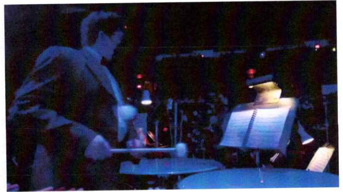
Ilustración 12 Sexta presentación de la segunda temporada de la Ópera El Pueblo K'iche'