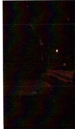
Ilustración 8 Cuarta presentación de la segunda temporada de la Ópera El Pueblo K'iche'