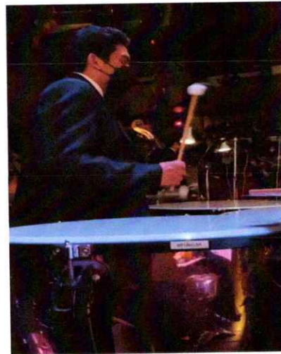
Ilustración 14 Séptima presentación de la segunda temporada de la Ópera El Pueblo K'iche'