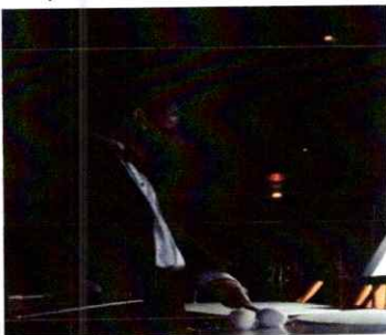
Ilustración 1 Primera presentación de la segunda temporada de la “Ópera El Pueblo K’iche’

Realice la primera presentación de la ópera, interpretando los timbales en la sección de percusión, la cual fue la primera presentación de la segunda temporada de la misma. Esta primera presentación fue dirigida al público en general. Link: https://drive.google.com/file/d/1LwMKJ6v2E-juCfakfrYkoh6F-nub4K_X/view?usp=sharing