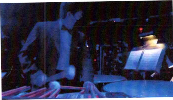
Ilustración 11 Sexta presentación de la segunda temporada de la Ópera El Pueblo K'iche'

Primera presentación de la "Ópera El Pueblo K'iché" Realice la sexta presentación de la ópera, interpretando los timbales en la sección de percusión, la cual fue la sexta presentación de la segunda temporada de la misma. Esta sexta presentación fue dirigida al público en general. Link: https://drive.google.com/file/d/1okzgwZJDT0XBgATR_yCeluejKSkR7ohf/view?usp=sharing