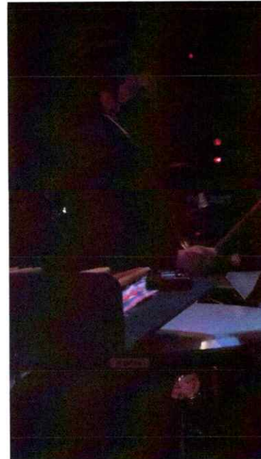
Ilustración 4 Segunda presentación de la segunda temporada de la Ópera El Pueblo K'iche'