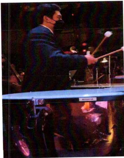
Ilustración 13 Séptima presentación de la segunda temporada de la Ópera El Pueblo K'iche'

Primera presentación de la "Ópera El Pueblo K'iché" Realice la séptima presentación de la ópera, interpretando los timbales en la sección de percusión, la cual fue la séptima presentación de la segunda temporada de la misma. Esta séptima presentación fue dirigida al público en general. Link: https://drive.google.com/file/d/1xzX7EfV2TxlyW60LWMAv_TeEaCzPtdU/view?usp=sharing