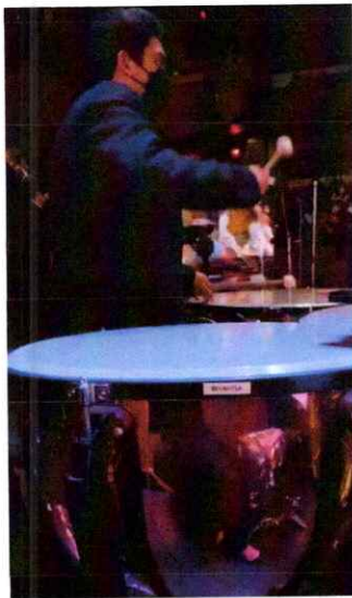
Ilustración 15 Octava presentación de la segunda temporada de la Ópera El Pueblo K'iche'

Realice la sexta presentación de la ópera, interpretando los timbales en la sección de percusión, la cual fue la octava presentación de la segunda temporada de la misma. Esta octava presentación fue dirigida al público en general. Link: https://drive.google.com/file/d/1bNchJ-1H1j-qisJ-nSsoP77-bhnUV-p7/view?usp=sharing