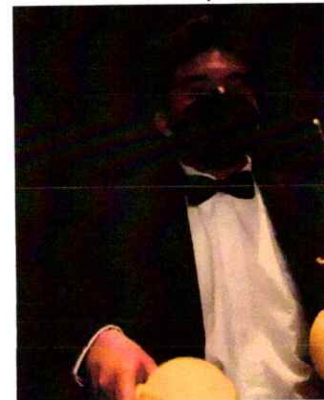
Ilustración 17 Novena presentación de la segunda temporada de la Ópera El Pueblo K'iche'